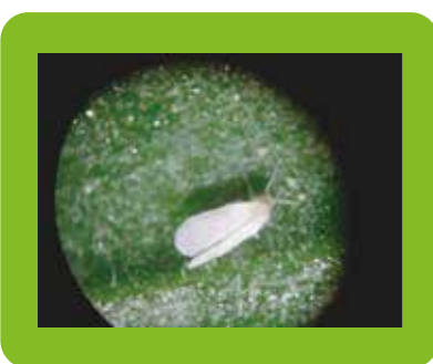
Mouche Blanche avant application

LIMOCIDE® agit de façon physique sur certains parasites en deshydratant leur cuticule. Les terpènes d'oranges présents dans l'huile essentielle détruisent les phospholipides, constituants de la cuticule. La cuticule ne joue plus son rôle de barrière physique. Elle se rompt comme montré ci-dessous. L'insecte dessèche avec une action de brûlure. Les cibles visées sont principalement les insectes à corps mou tels les mouches blanches, thrips, pucerons, cicadelles qui ont une cuticule suffisamment fine pour être détruite par l'application de LIMOCIDE®. LIMOCIDE® agit avec un effet de choc compris entre 24 h / 72 h.