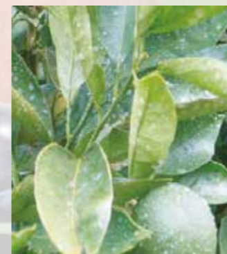
Etalement de la bouillie sans LIMOCIDE®

LIMOCIDE® est un pur produit de contact. La notion de qualité de pulvérisation est primordiale afin de multiplier le nombre d'impacts et la pénétration de la canopée. LIMOCIDE® présente une excellente capacité d'étalement qui favorise sa mise en action y compris sur des feuillages peu mouillables.