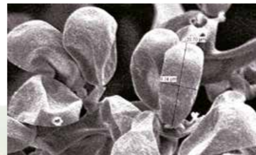
Spores de mildiou 24 heures après l'application de LIMOCIDE®. Effet desséchant avec perte de turgescence des spores

LIMOCIDE® agit de façon physique sur les formes aériennes des champignons (mildiou, botrytis...) en deshydratant les parois cellulaires. LIMOCIDE® agit avec un effet de choc compris entre 24 h / 72 h.