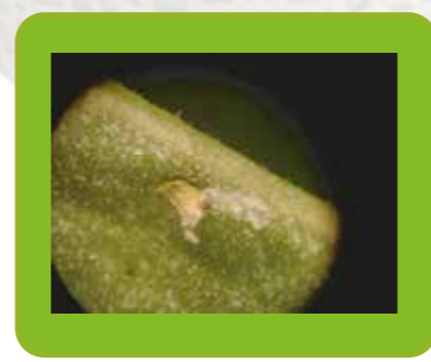
24 h. après l'application LIMOCIDE