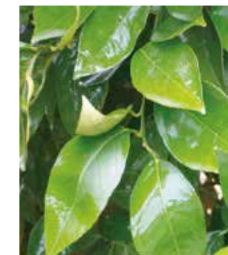
Etalement de la bouillie avec LIMOCIDE® (0,4% v/v)

LIMOCIDE® est un pur produit de contact. La notion de qualité de pulvérisation est primordiale afin de multiplier le nombre d'impacts et la pénétration de la canopée. LIMOCIDE® présente une excellente capacité d'étalement qui favorise sa mise en action y compris sur des feuillages peu mouillables.